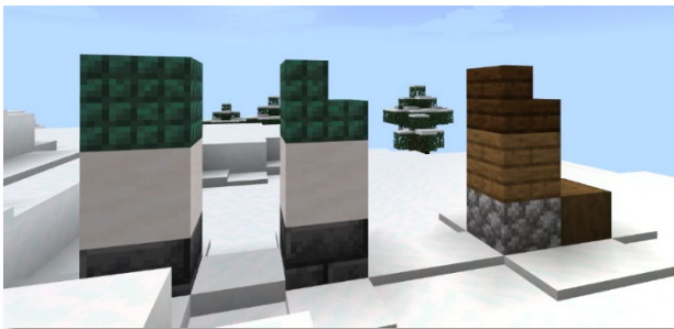
Suunnitelmaa mitä kuutioita käytätte rakentamiseen.