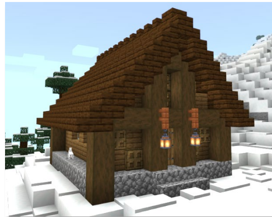
Esimerkki perinteisestä mökistä.