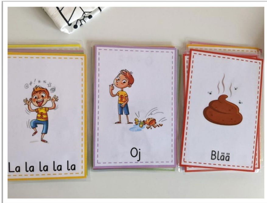
Bildtext: Bildkort som exempelvis kan användas med barnen för att härma olika ljud.

Utöver bildstödkort kan en språkstund ha utgångspunkt i böcker. Vi har en bok som barnen gillar och en del av boken har vi översatt till engelska. Det finns också en sångpåse på engelska och en påse med små djur som barnen kan känna på.