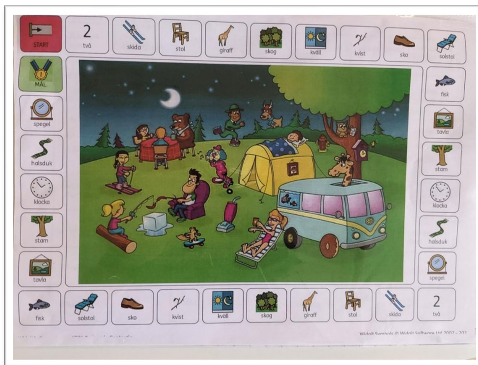
Bildtext: Ett spel kan locka till språkanvändning.

Spel kan också användas för glädjande språkstunder. Barnen övar bland annat turtagning och att beskriva. Barnen slår turvis en tärning och går det antal steg som tärningen visar. Om ett barn hamnar exempelvis på "Giraff" ska barnet hitta giraffen på den stora bilden. Sedan kan man be barnet beskriva var giraffen är.