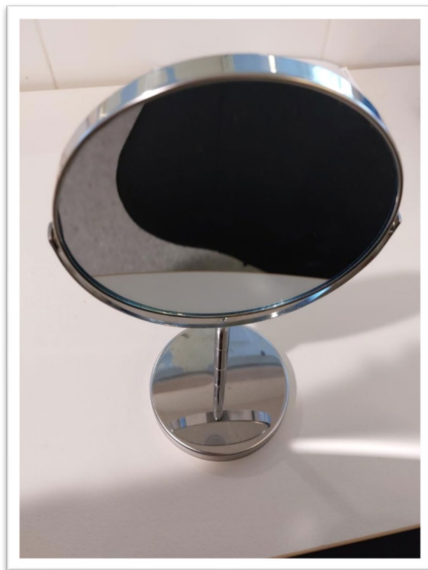
Bildtext: En spegel som barnen får använda under aktiviteten.