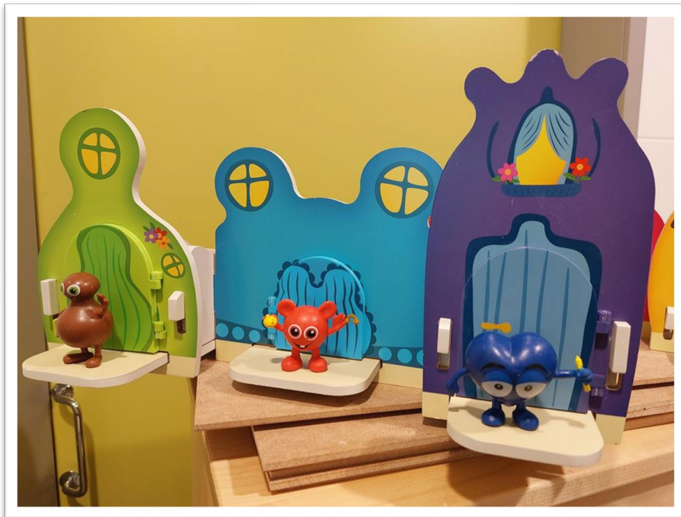
Bildtext: Babblarnas tre hus och tillhörande figurer.

Vi delade upp gruppen i två mindre grupper: de äldre och de yngre barnen. Vi hade fram Babblarnas hus och de små figurerna. Figuren Bobbo kom ut och var glad. Sedan kom figuren Doddo som var arg och till sist figuren Babba som var ledsen.