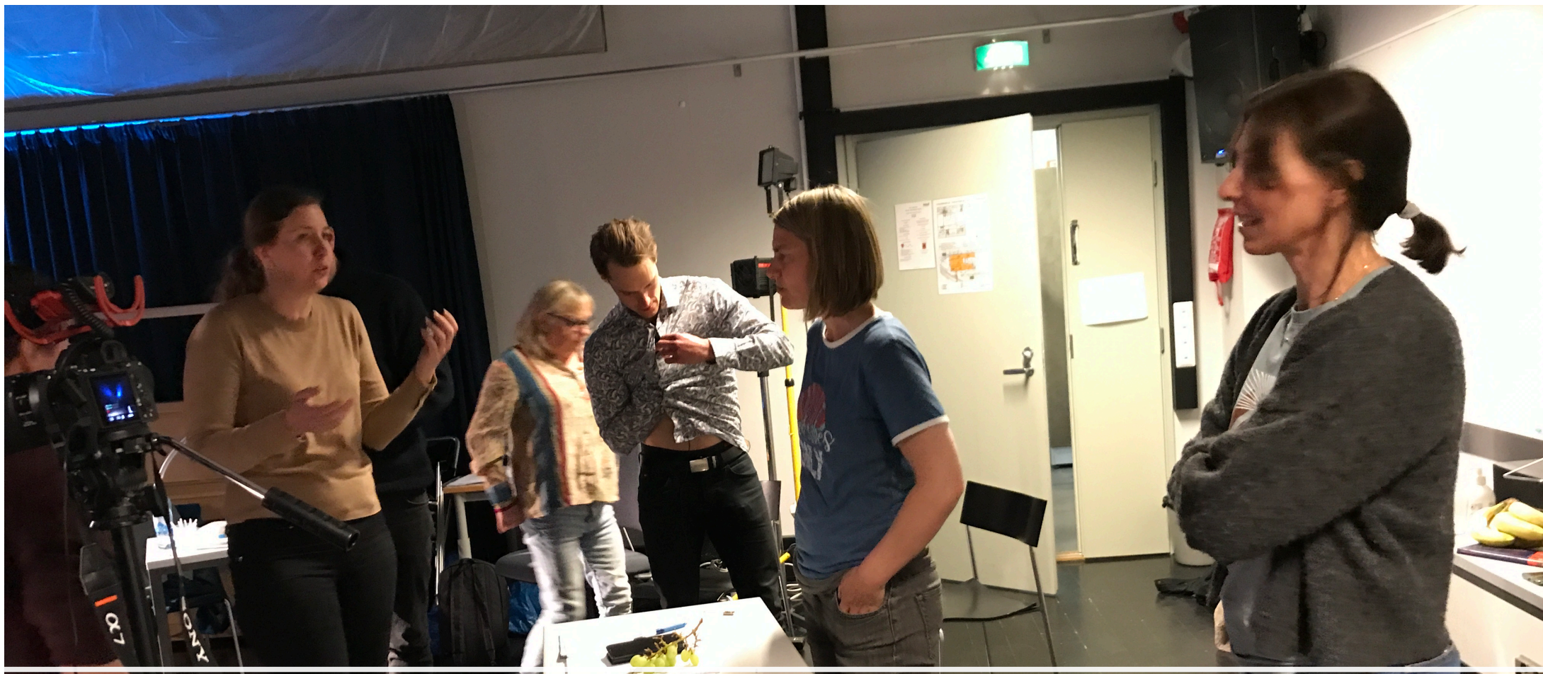
Drøfting og utvikling av film-eksemplene