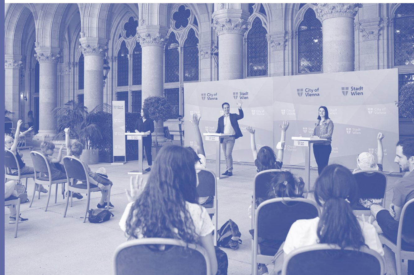
↑ Itävalta, 2021. Wienin Lasten ja nuorten parlamentti.