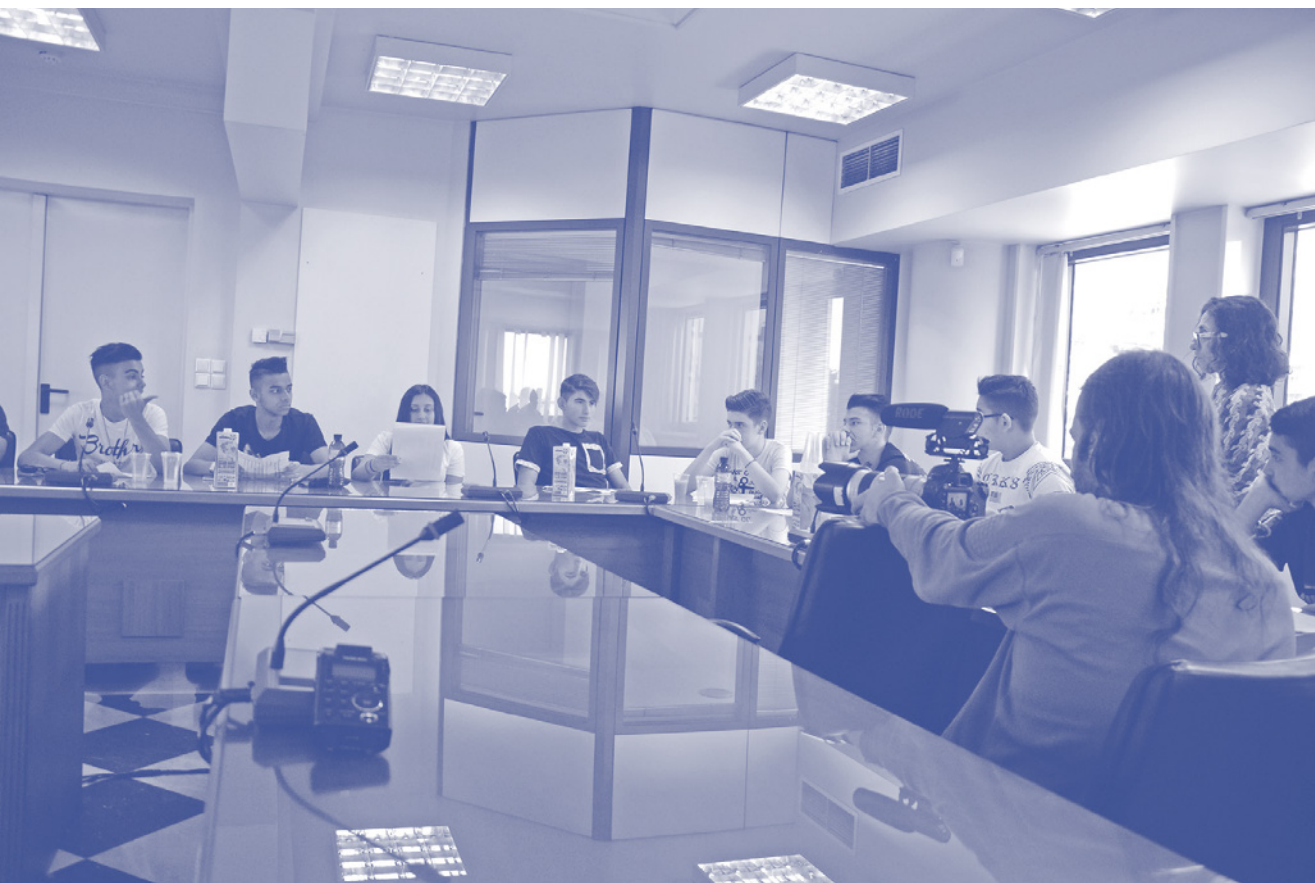
↑ FRA:n Paikallinen toiminta romanien osallistamiseksi -hanke. Romaninuoriso keskustelee etnisten ryhmien välisistä suhteista pormestarin kanssa Aghia Varvarassa, Kreikassa.